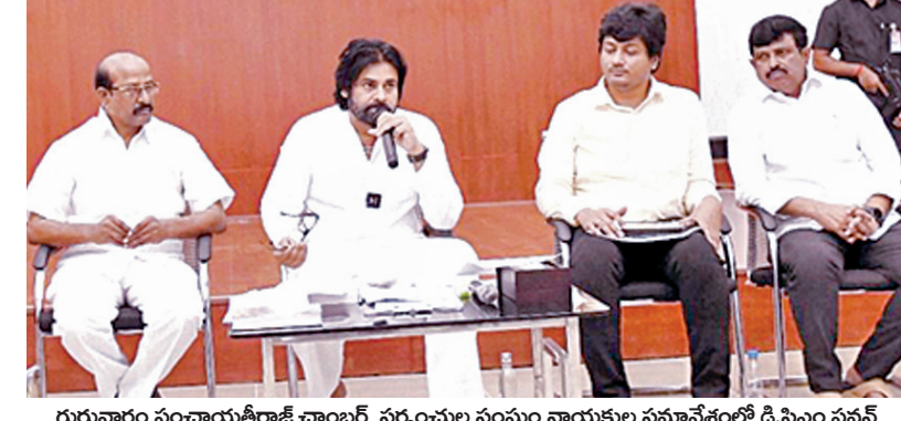
గురువారం పంచాయతీరాజ్ ఛాంబర్, సర్పంచ్ల సంఘం నాయకుల సమావేశంలో డి.సిఎం పవన్

విజయవాడ, నవంబరు 7, ప్రభాతవార్త ప్రతినిధి: పంచాయతీరాజ్ వ్యవస్థను అత్యంత పటిష్ఠంగా తీర్చిదిద్దడానికి ఉప ముఖ్యమంత్రి పవన్ కల్యాణ్ స్పష్టం చేశారు. గత ప్రభుత్వం పంచాయతీరాజ్ చట్టాన్ని ఇష్టానుసారం నిరీకర్యం చేసిందన్నారు.