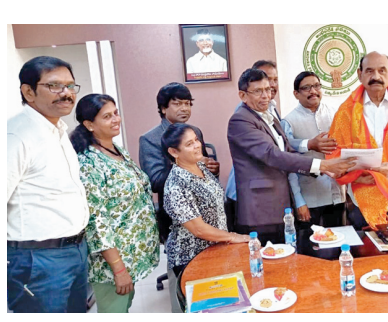
రాష్ట్ర మైనార్టీ సంక్షేమ న్యాయశాఖ మంత్రి ఎన్ఎండి ఫరూక్ ఆంగ్లో ఇండియన్లను

- రాష్ట్ర మైనార్టీ సంక్షేమ, న్యాయశాఖ మంత్రి ఎన్ఎండి ఫరూక్ - మంత్రిని కలిసిన ఆంగ్లో ఇండియన్ ప్రతినిధుల బృందం