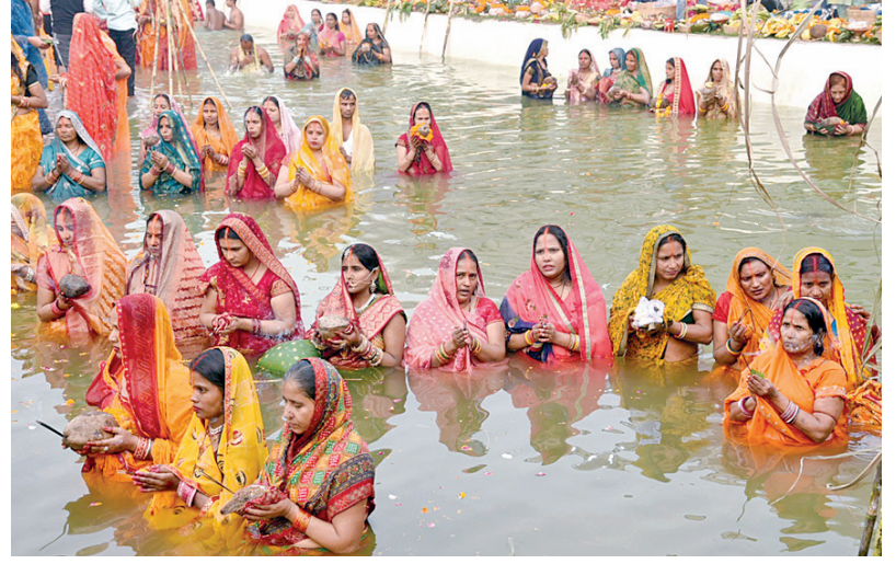
గురువారం న్యూఢిల్లీలోని బాబీ చంద్ర ఛాట్ పూజలో పాల్గొన్న మహిళలు

ప్రత్యేక రైల్వే సంఖ్య వివరాలు: ఈ నెల 3వ మొత్తం 207రైల్వే, 4వ 203రైల్వే, 5వ 171రైల్వే, 6వ 164 ప్రత్యేక రైలు సర్వీసులు, 7వ 164రైల్వే సర్వీసులు ప్రయాణికులకు చేశారు. అలాగే ఈ నెల 8వ శుక్రవారం సూర్యోదయం నుంచి ప్రారంభమయ్యే చత పూజ తిరుగు ప్రయాణ రద్దీని దృష్టిలో ఉంచుకుని నడవడానికి ప్రయాణికులను రైల్వే వివరాలు ఇలా ఉన్నాయి. ఈ నెల 8వ 164రైలు సర్వీసులు, 9వ 160రైల్వే, 10వ 161రైల్వే, 11వ 155రైల్వే ప్రయాణికుల రద్దీ, డిమాండ్ల మేరకు సమన్వయం, దానాపూర్ రైల్వే డివిజన్లు మరలొకప్పుడు రైల్వే నడిపింది. ప్రయాణికులు రూపొందించినట్లు రైల్వే వర్గాల సమాచారం.