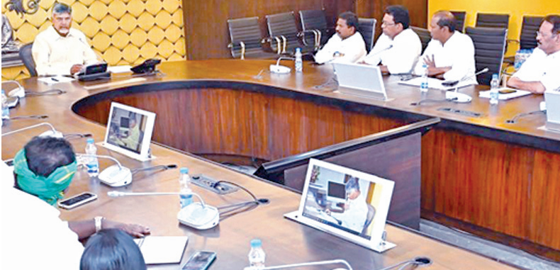
గురువారం సభివాలయంలో దళిత ఎమ్మెల్యేలతో భేటీ అయిన సిఎం చంద్రబాబు

కాలువ్యంపై జరిమానాలు రెట్టింపు చేసిన కేంద్రం 5